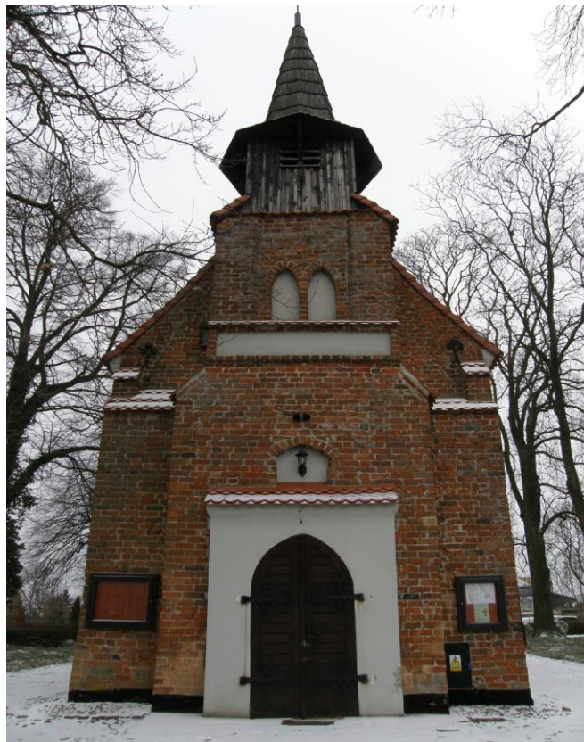
Kościół w Budzistowie z 1222 r. – najstarsza zachowana świątynia na Pomorzu Zachodnim

Narzucenie Pomorza polskiego zwierzchnictwa wiązało się z ostatecznym wprowadzeniem chrześcijaństwa. Główna akcja chrystianizacyjna została przeprowadzona z inicjatywy Bolesława Krzywoustego w zachodniej części Kaszub (księstwie zachodniokaszubskim). Misją tą kierował Otto, biskup Bambergu. Zachodnia część ziem kaszubskich podlegała powstałemu w 1140 r. biskupstwu w Wolinie. W wyniku najazdów duńskich Wolin został zniszczony, a siedzibę biskupią przeniesiono do Kamienia Pomorskiego (1176 r.). Wschodnia część Kaszub wchodziła w XI w. zapewne w skład diecezji kruszwickiej (zakładając, że w ogóle taka diecezja istniała), a od XII w. – wrocławskiej (kujawsko-pomorskiej).