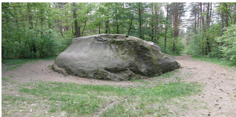
Kamień św. Wojciecha w Leosi koło Świecia – według legendy z tego miejsca miał głosić kazanie św. Wojciech

W drugiej połowie X w. ziemie pomorskie pomiędzy Wisłą a Odrą dostały się pod panowanie polskie. Określa się to jako pierwszy piastowski podbój Pomorza. Nie wiadomo jednak dokładnie kiedy to nastąpiło, ani w jaki sposób. W 1000 r., na mocy postanowień zjazdu gnieźnieńskiego (spotkanie księcia polskiego Bolesława Chrobrego z cesarzem Ottonem III), powołano do życia biskupstwo w Kołobrzegu. Trzy lata przed jego powołaniem, do Gdańska przybył Wojciech, biskup Pragi. Celem jego misji była chrystianizacja Prusów, a Gdańsk był przedostatnim etapem tej podróży. W Gdańsku – jak podaje Jan Kanapariusz (biograf św. Wojciecha) gromady ludu przyjmowały chrzest . Chrześcijaństwo jednak nie zakorzeniło się na Pomorzu. Zaledwie kilka lat po utworzeniu biskupstwa kołobrzesckiego zachodnia część Pomorza odzyskała niepodległość, a prawdopodobnie w połowie XI w. uniezależniła się też jego wschodnia część.